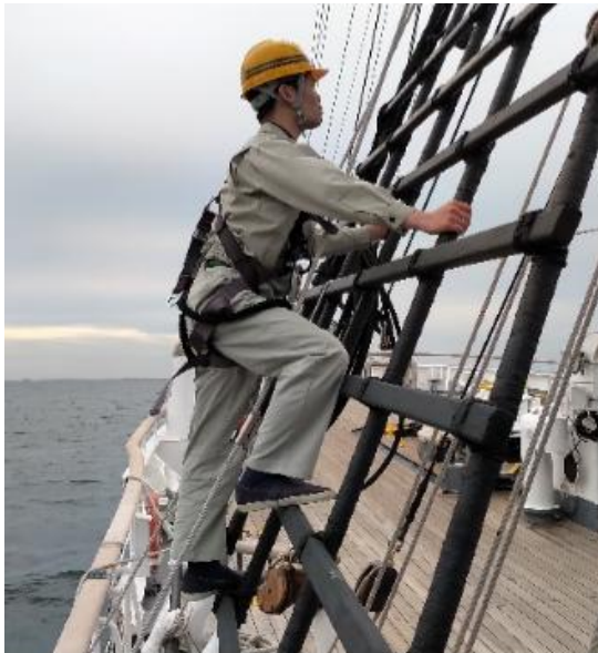
マスト登りの体勢